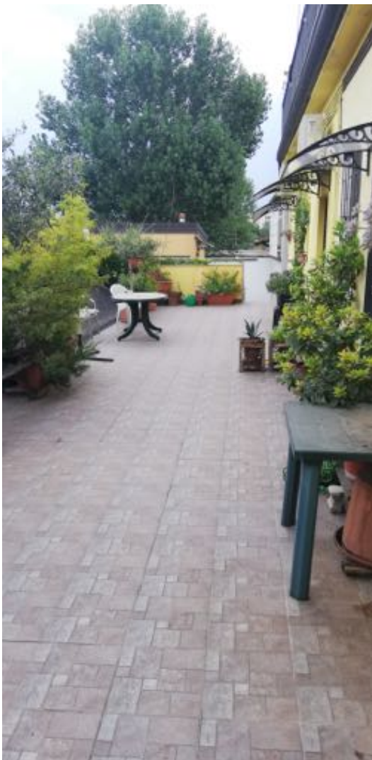
BALLATOIO COMUNE PIANO PRIMO